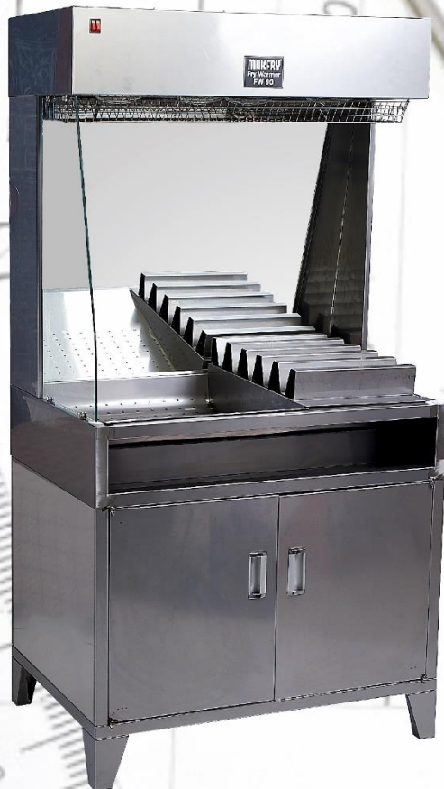
MAKFRY FW 90 FRENCH FRIES WARMER